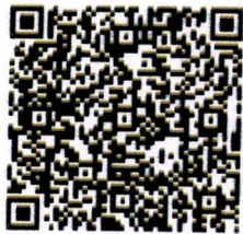
ดาวน์โหลดแบบรายงาน